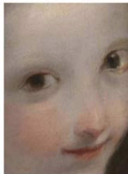
De Nieuwe Smaak

17 januari t/m 21 augustus 2016 - Van Jacob Jordaens tot