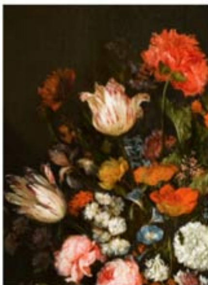
De Gouden Eeuw van Twente